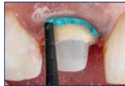
Fácil aplicación en el surco